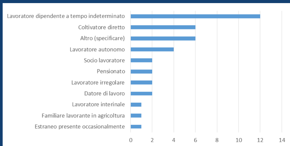
Distribuzione degli infortuni mortali nella Regione del Veneto per ruolo. Gennaio - Novembre 2022