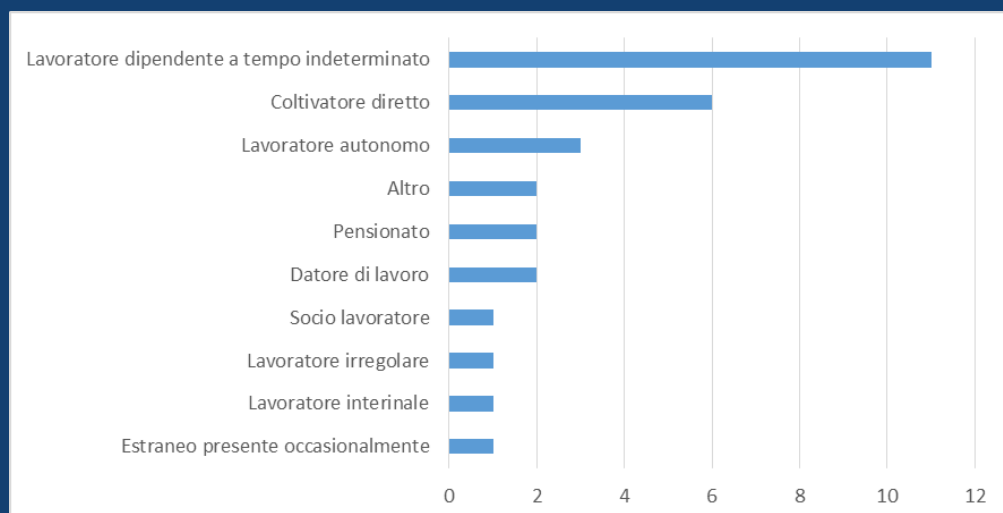
Distribuzione degli infortuni mortali nella Regione del Veneto per ruolo. Gennaio - Agosto 2022